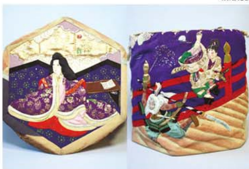
きりばめ細工の袋物 静御前 / 弁慶、牛若丸