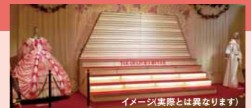
イメージ実際とは異なります

フィナーレ体験大階段(模型)が登場。背負い羽根をつけ、シャンシャンを持って記念撮影ができます。カメラ等をご持参ください。