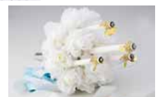
舞台小道具「シャンシャン」