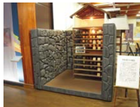
荒船風穴の模型（当館で展示中）