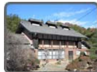
高山長五郎生家 （高山社発祥の地）