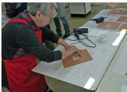
布に型染めしています。