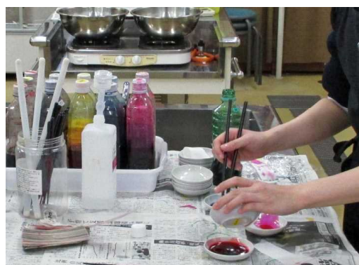
色を調合しています(講師)。