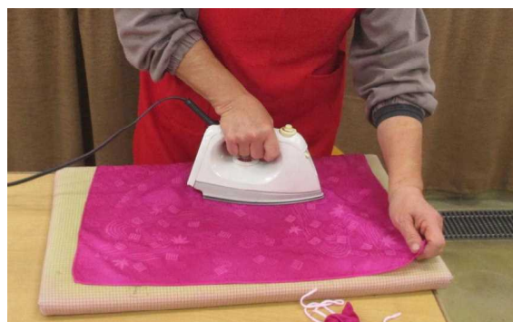
アイロンをかけ完成です。