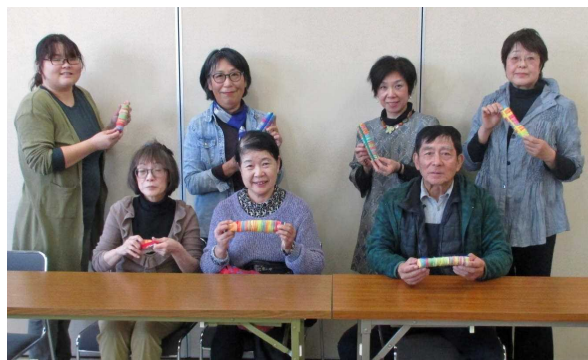
午後参加の皆さんと作品