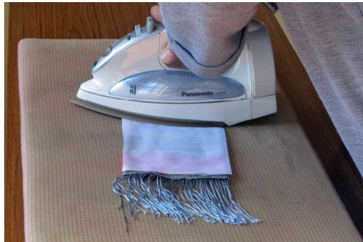
織り上がった布の裏に接着芯を付けます