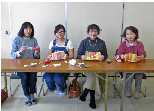
午前中参加の皆さんと作品（織り上がり、ペンケースに仕上げる前のものもあります）