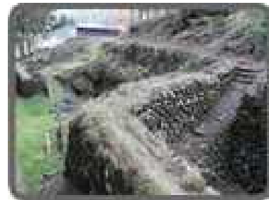
あらかぶねふうけつ 荒船風穴