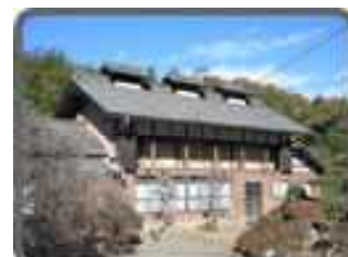
たかやまちょうごろうせいけい 高山長五郎生家 （高山社発祥の地）