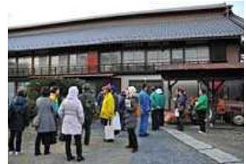
たじまやへいきゆうたく 田島弥平旧宅

さて、田島弥平旧宅は、カイコを育てるために特殊な工夫がされています。このような形をした家は養蚕地帯に多く見られます。さてどのような構造をもった家でしょうか。