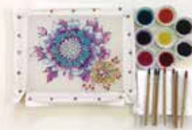
ワークショップ作品例