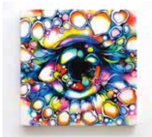
桃源畑を見つめる瞳