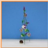
6月 あさがお (材料費350円)