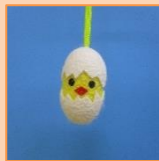
7月・8月 ヒヨコちゃんストラップ (材料費180円)