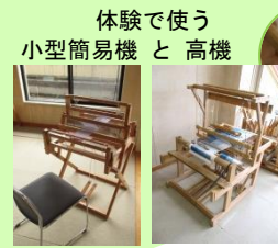
体験で使う 小型簡易機と高機