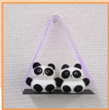
5月 ふたごのパンダ (材料費500円)