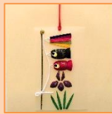
4月 まゆ絵こいのぼり (材料費500円)