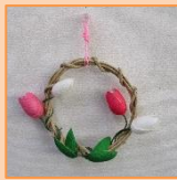
3月 チューリップのかべかざり (材料費500円)