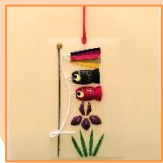
4月 まゆ絵こいのぼり (材料費500円)