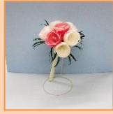
6月 ミニミニブーケ (材料費500円)