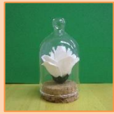
5月 ミニバラのオブジェ (材料費500円)