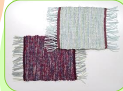
コースター (平織り / 4枚綜織)