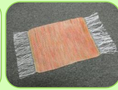
ランチョンマット (平織り / 4枚綜織)