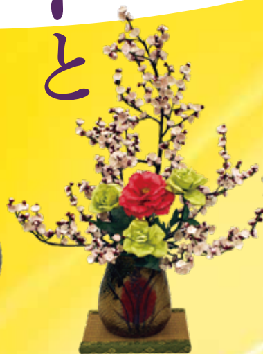
「春のおとづれ」 (令和4年度入賞作品)