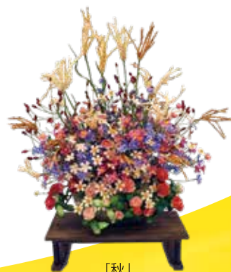
「秋」 (令和4年度入賞作品)