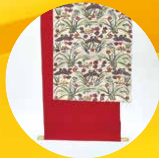
「琉球紅型風タペストリー」 友の会会員