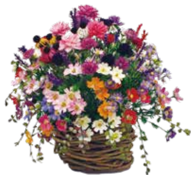
「夏から秋へ共に咲く」 (令和4年度入賞作品)