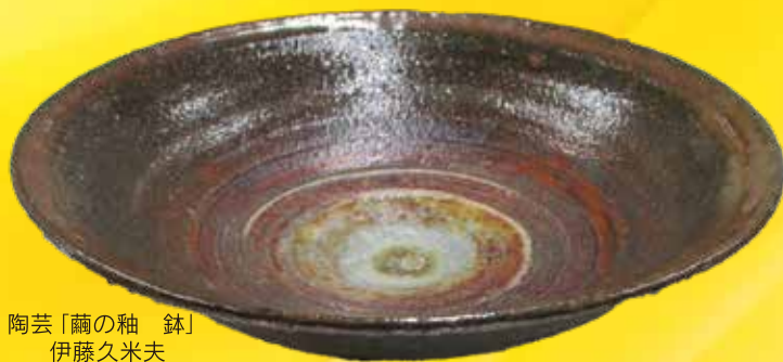
陶芸「繭の釉 鉢」 伊藤久米夫