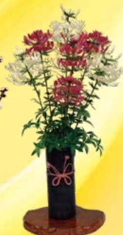
「風蝶草」 (令和4年度入賞作品)