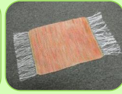
ランチョンマット (平織り / 4枚綜織)