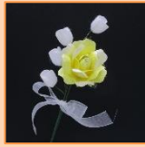
5月 黄色いバラ (材料費350円)