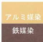
アルミ媒染 鉄媒染