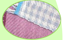
まいろうこう 4枚綜織 (綾織り) (千鳥格子の模様が できます)