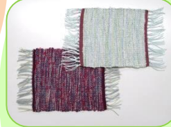
コースター (平織り / 4枚綜織)