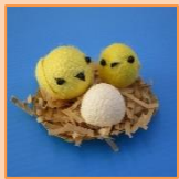
3月 きいろい鳥 (材料費350円)