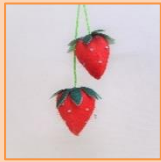
4月 ハートいちごストラップ (材料費350円)