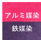
アルミ媒染 鉄媒染