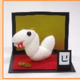
12月 干支ヘビ (材料費500円)