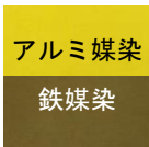
アルミ媒染 鉄媒染