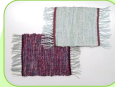
コースター (平織り/4枚綜織)