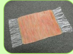
ランチョンマット (平織り/4枚綜織)