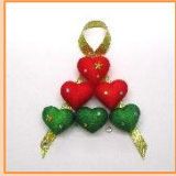
11月 ハートのクリスマスかざり (材料費500円)