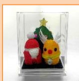
11月 サンタとツリー (材料費500円)