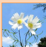
10月 コスモス (材料費350円)