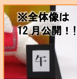
※全体像は 12月公開!! 12月 干支ウマ (材料費500円)