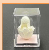
2月 まゆいろの妖精 (材料費500円)