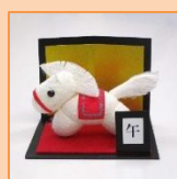
12月・1月 干支ウマ (材料費500円)