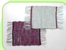
コースター (平織り／4枚綜紉)