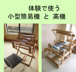
体験で使う 小型簡易機 と 高機