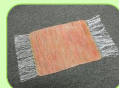
ランチョンマット (平織り／4枚綜紉)