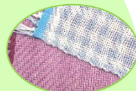
まいろうこう 4枚綜紉（綾織り） (千鳥格子の模様が できます)