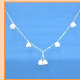
5月 白い小花のガーランド (材料費500円)