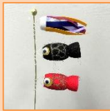
4月 こいのぼり (材料費500円)