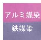
アルミ媒染 鉄媒染