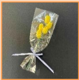
3月 黄繭チューリップ (材料費500円)