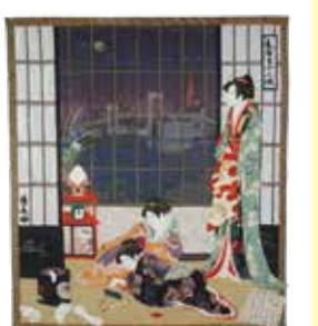
「月見の夜に待ち人來たらず」

9月17日(木) 13:00~15:00 内容: バッグの中に入れるスマホケース(約20×13cm)を作ります。 参加費: 2,800円 📍 定員: 20名 対象: 18歳以上 持ち物: 裁縫道具、はさみ(紙用・布用)、縫い糸(黒・白)、筆記用具、必要な方はメガネ等 申込: 電話予約 8月17日(月) 9:30~ 受付開始 📍