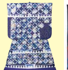
「本日はお日柄もよく vol.14 江戸切子」

10月9日(金) 13:00~15:00 内容: 簡単に使いやすい袱紗(約11×20cm)を作ります。2枚セットで当日は1枚を制作し、1枚はキットでお持ち帰りとなります。 参加費: 2,500円 📍 定員: 20名 対象: 18歳以上 持ち物: 裁縫道具、縫い糸(黒・ベージュ)、筆記用具、必要な方はメガネ等 申込: 電話予約 8月17日(月) 9:30~ 受付開始 📍